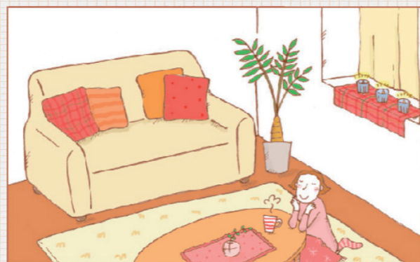
※キャンドルを使う際は、火のもとに注意しましょう。

さらに、素材にもこだわって、断熱効果の高いカーテンや、さわり心地・保温性に優れたシルクやウール、フェイクファーなどのラグマットを採用しても良いでしょう。また、出窓などのお部屋の一角に暖色のクロスを敷いて、キャンドルをちょこっと飾るだけでもぬくもりを感じられますよ。