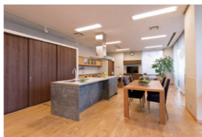
▲シンサナミ横浜ショールームの壁紙にも「シラス壁」を使用しております。

「シラス壁」は南九州にある広大な「シラス台地」から採れた特殊な土「シラス」を使った壁材。表面にとっても細かな凹凸が有るので、例えば8畳の部屋に対して東京ドーム17個分の表面積が有ると言われています。そのため、調湿機能、消臭機能に非常に優れています。また100%自然素材から生まれているので、まさに「安心・安全・エコ」な壁材です。